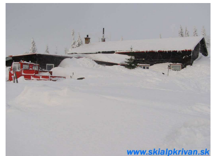
Chata v zajatí snehu

Na chate je elektrina a signál pre mobilné telefóny je v chate slabý, no pred chatou je už dobrý.