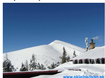
Veľký Fatranský Kriváň

Už samotný výstup alebo prístup na chatu je dobrou skialpinistickou túrou. Prevýšenie zo Zajacovej na chatu je 685 m. Na chatu sa dá ísť aj zo severu, a to z Vrátnej doliny . Od údolnej stanice lanovky do Snílovského sedla po lyžiarskej zjazdovke, potom kúsok po hrebeni smerom na Chleb a od odbočky na Chatu pod Chlebom už zlyžujete. Prevýšenie je tu okolo 800 m.