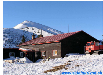
Chata pod Chlebom, v pozadí VF Kriváň

Chata pod Chlebom je horská chata, ktorá sa nachádza v Malej Fatre. Stojí v nadmorskej výške 1420 m.n.m. pod Chlebom (1646 m.n.m.), z toho vychádza aj názov. Chata nestojí na hrebeni Malej Fatry, ale na južnej strane pod hrebeňom. Za pekného počasia sa pred chaty ponúkajú nádherné výhľady. Za chatou je vidno Chleb a Veľký Fatranský Kriváň . Na východ vidno Západné Tatry a Veľký Choč , priamo pred chatou je vidno časť hrebeňa Nízkyh Tatier a Veľkú Fatru a vpravo Martinské hole .